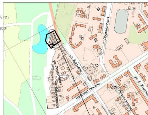
Границы образуемых земельных участков