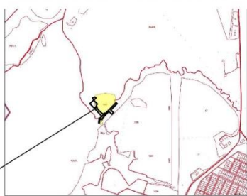
СХЕМА РАСПОЛОЖЕНИЯ ОБРАЗУЕМЫХ ЗЕМЕЛЬНЫХ УЧАСТКОВ