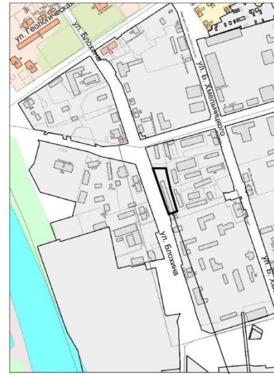
Граница образуемого земельного участка