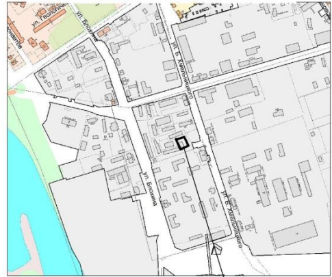
Граница образуемого земельного участка