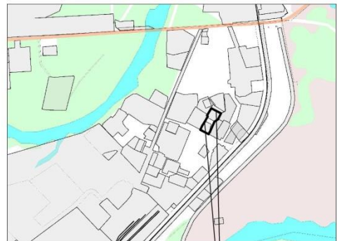
Граница образуемого земельного участка

Технические решения, принятые в проектной документации соответствуют требованиям экологических, санитарно-гигиенических, противопожарных и других норм, действующих на территории Российской Федерации.