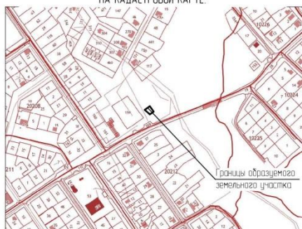
Границы образуемого земельного участка

Технические решения, принятые в проектной документации соответствуют требованиям экологических, санитарно-гигиенических, противопожарных и других норм, действующих на территории Российской Федерации. Главный инженер проекта: Тянгулова З.Х.