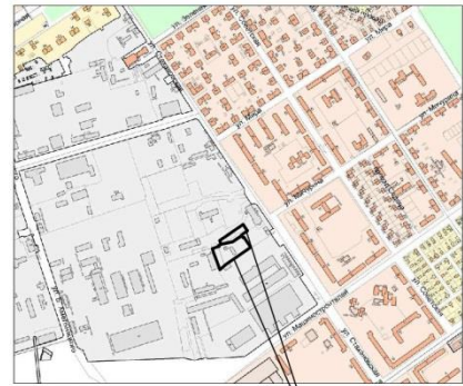
Границы образуемых земельных участков