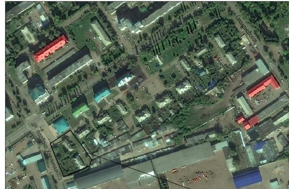
СХЕМА РАСПОЛОЖЕНИЯ ПРОЕКТИРУЕМОЙ ТЕРРИТОРИИ СИТУАЦИОННЫЙ ПЛАН